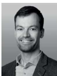
Rennstrecke Marc Schwab