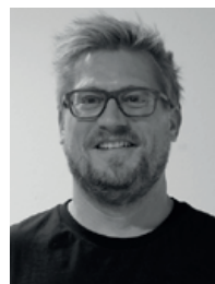
Sekretariat Markus Bühler