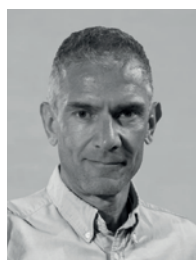
Werbung, Medien Martin Scheidegger