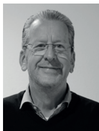
Präsident Markus Malachowski